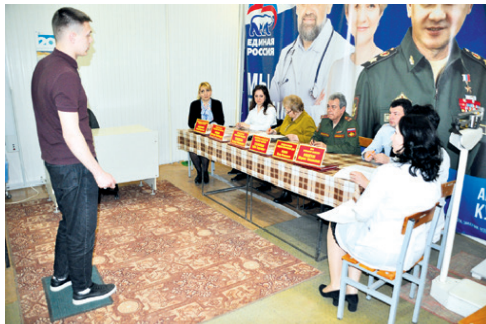
Полосу подготовила Анна БЕЛОУСОВА

– Добровольцев достаточно много. Оформляем, отправляем на службу. По всем вопросам следует обращаться: г. Пятигорск, ул. 40 лет Октября, 52, тел. 8 (8793) 32-01-80, военный комиссариат.