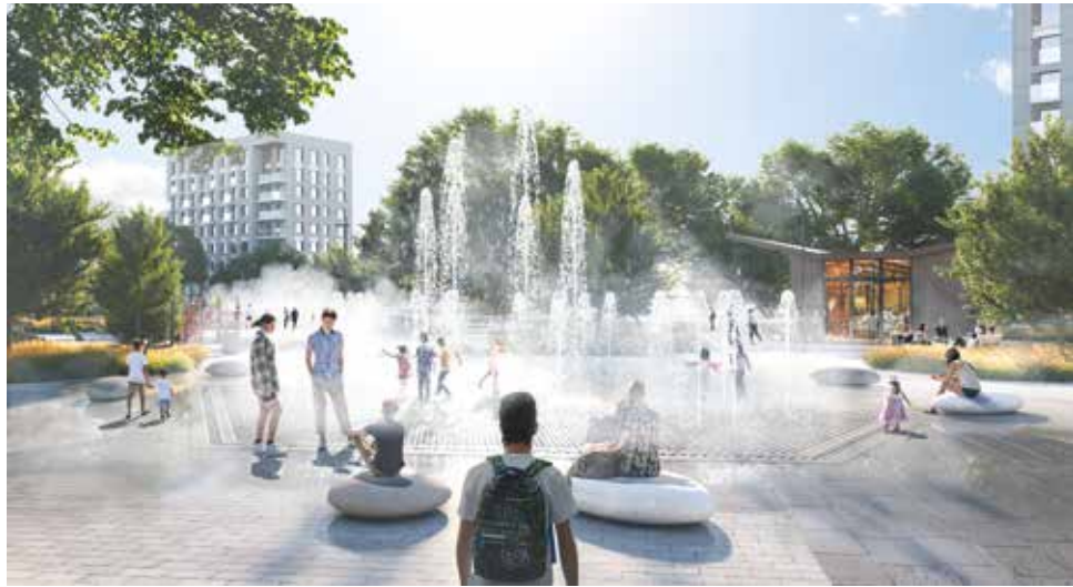
Фото пресс-службы администрации г. Ессентуки и визуализация проекта