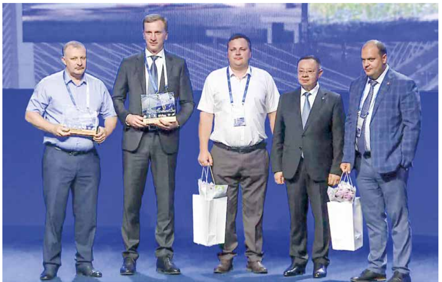
Во время награждения победителей проекта министром строительства и жилищно-коммунального хозяйства РФ Иреком Файзуллин (второй справа) ставропольской делегации.

В конкурсе проектов благоустройства участвовали города с численностью населения до 200 тысяч человек, а также исто-