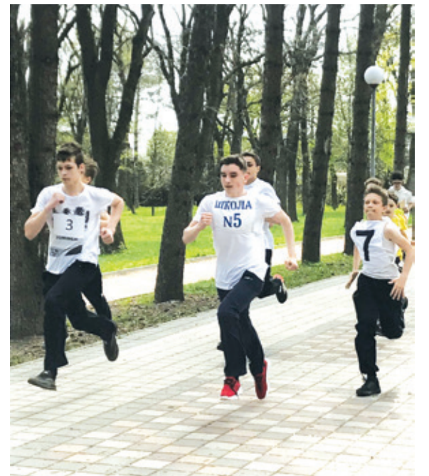
Полосу подготовила Анна БЕЛОУСОВА.