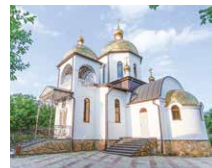
Подготовила Валерия ПЕТРОВА

Территория комплекса огромна и на ней постоянно ведется благоустройство. Для молодоженов у храма поставили венчальные ворота. В будущем есть замысел создать на этом месте сооружение по подобию святынь Иерусалима. Но кроме православных святынь, здесь можно найти много интересного, просто заглянув на променад, — малые архитектурные формы, сад с необычными и красивыми растениями, фонтан, в котором живет большая семья черепах, коллекция ретроавтомобилей и привлекающие внимание фотозоны. Для маленьких туристов у входа построили детскую площадку и собрали «мини-зоопарк». Приехать сюда стоит в любое время года, каж-